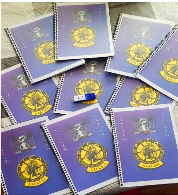
MATERIAL DE LOS CURSOS. A los alumnos se les facilita mínimamente, varios conceptos básicos sobre los cursos.

Desde el pasado octubre, la Asociación PICA dirige un taller para alumnos de dicho centro. Después de mucho esfuerzo e ilusión, y orgullosos del trabajo de los chavales, os presentamos esta primera entrega.