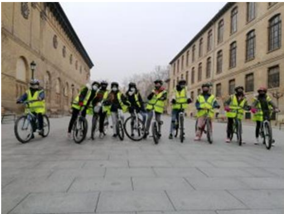
Grupo de alumnos participantes en la actividad.