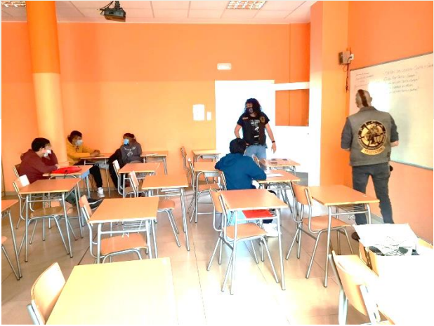
Clase con los Alumnos del Cantín y Gamboa